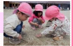
りす組 ほら、虫がいるよ。