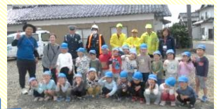
交通安全に気をつけてくださいね!

春の全国交通安全運動に合わせ5歳児きりん組が久多美地区の交通安全テント村の活動に参加しました。ドライバーの方に元気よく交通安全の呼びかけをしました。