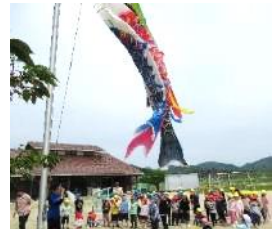
わあ! 元気に泳いだね。