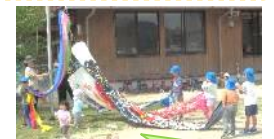
泳ぐかな?楽しみだね!