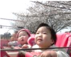
ひよこ組 桜の花を見に行ったよ。

新しいクラスになり、今まで使ったことのない玩具や用具などで遊ぶ機会も増えました。物の扱いについて、保育士が手本となって知らせ、使い方や片付け方を話し合う機会も持ちながら、物を大切にすることを育てていきたいと思っています。小さいクラスは、遊びや生活の中で物を大切に扱う姿を見せたり、一緒に片付けをしたりします。