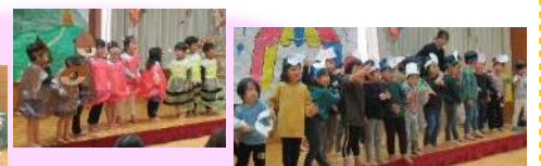
わくわくのしい ほっぴょうかい ～ひとひといが かがやいて～