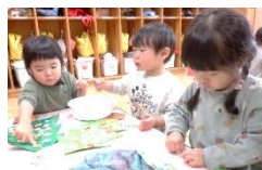
りす組 のり付けをして クリスマス飾りを 作ったよ。