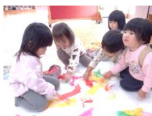
ごとい組 「はらべこあおむし」の ちょうちょうの羽だよ。