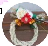
職員手作りの しめ飾り