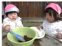
ひよこ組 砂遊びは楽しいな。