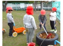
うさぎ組 もちつきごっこをしたよ。