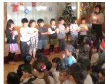
きりん組 クリスマス会でキャンドル サービスをしました。

こままわしや羽根つき・凧あげ・かるた・すごろく・福笑いなどの昔から伝わる伝承あそびを楽しみます。低年齢児には、扱いやすく楽しさが感じられる物を準備するなど、年齢に応じた遊び方を工夫して楽しめるようにしていきます。 生活目標～生活リズムを整えよう 年末年始は生活リズムが崩れがちになります。早寝・早起き・朝ごはんの生活リズムを整え、冬を元気に過ごしたいと願ひます。今月の生活習慣チャレンジ週間(1月20日～24日)に合わせて、お集まり会をし、職員劇をして生活リズムの大切さを伝えます。